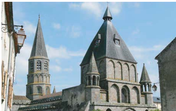
Collégiale du Dorat