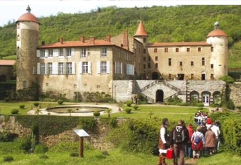
Château de la Bâtisse