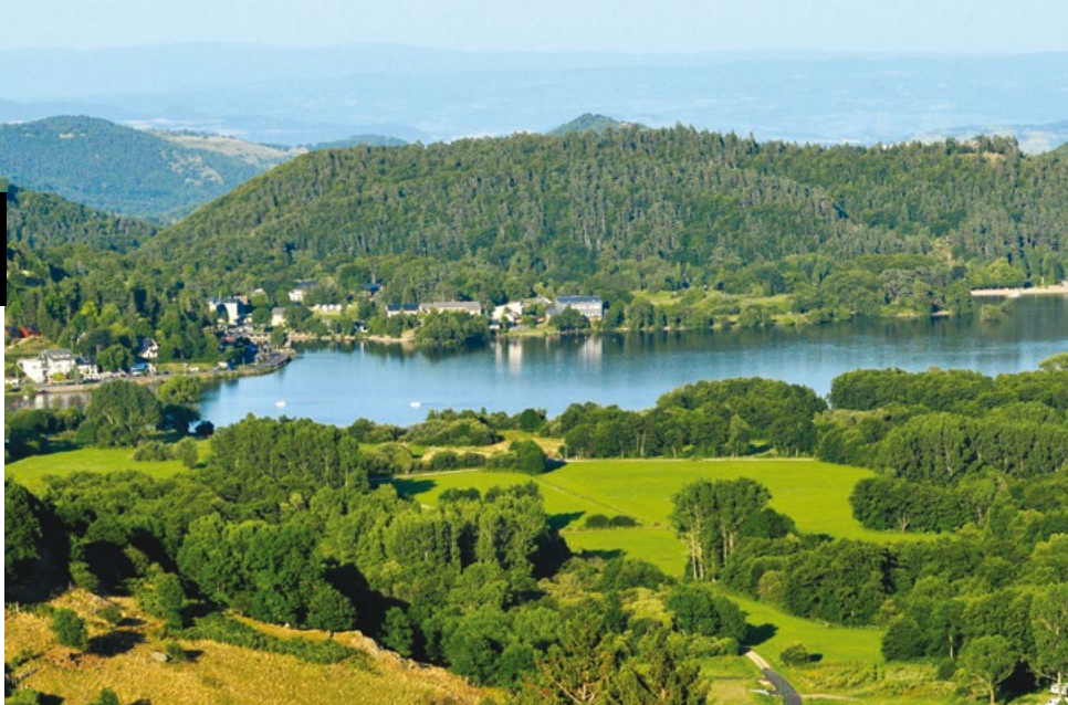
Vue panoramique sur la château de Murol et le lac Chambon

Un large choix d'excursions et de parcours rando ou cyclo, sélectionnés pour enrichir vos séjours « Liberté » et « Prêts à Partir ».