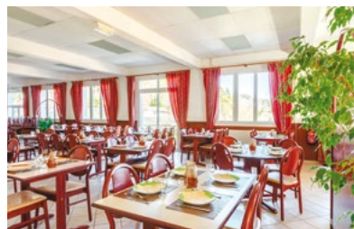
Salle de restaurant