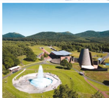
Le site de Vulcania